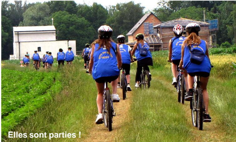
Elles sont parties !