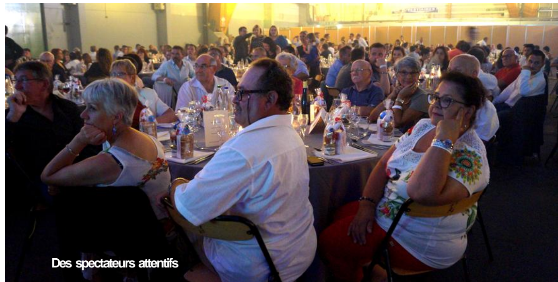
Des spectateurs attentifs