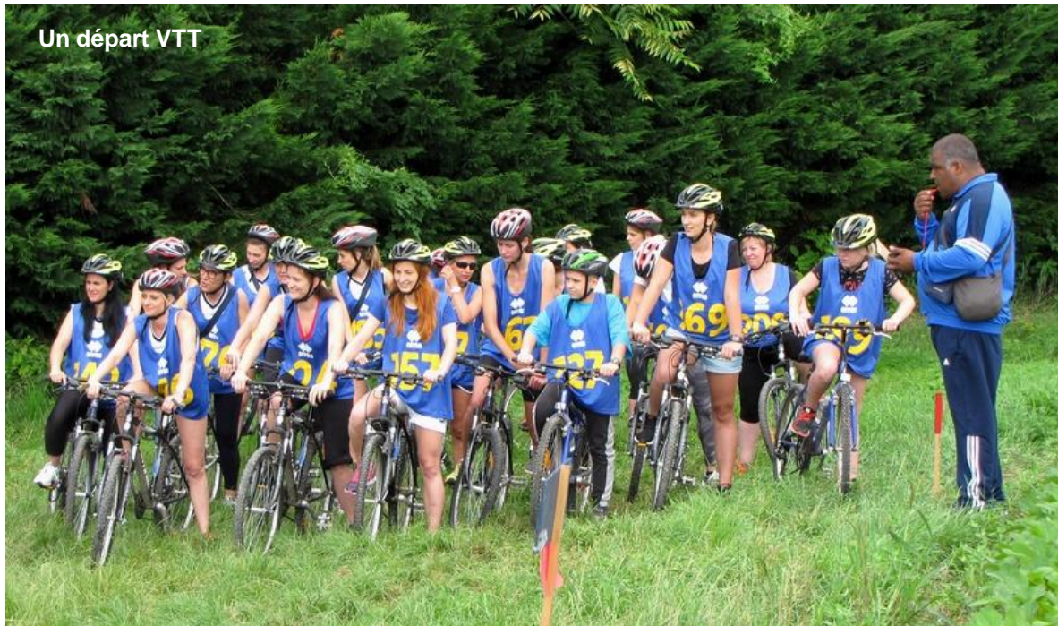
Un départ VTT