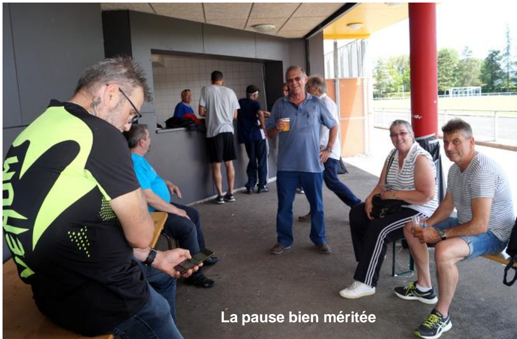
La pause bien méritée

La Fête du Sport GEFCO 2018, c'est pour demain .