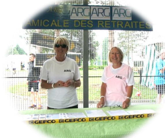
Le Stand de l'ARG et ses hôtes