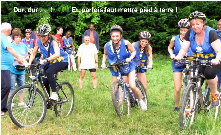
Dur, dur ... !!