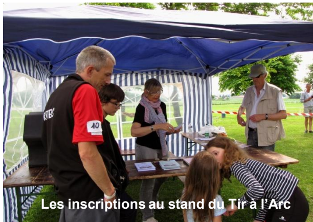
Les inscriptions au stand du Tir à l'Arc