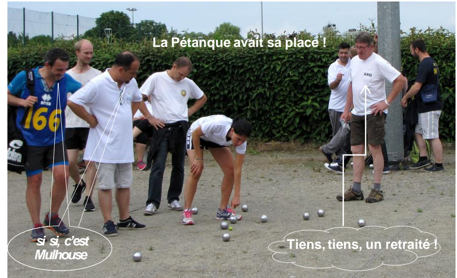
La Pétanque avait sa place !