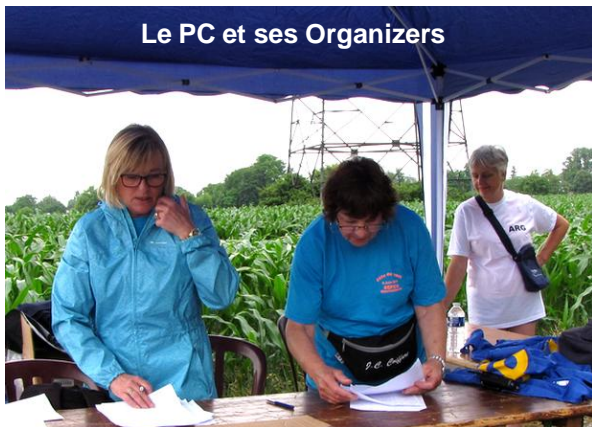
Le PC et ses Organizers