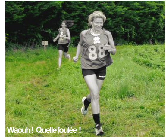
Waouh ! Quelle foulée !