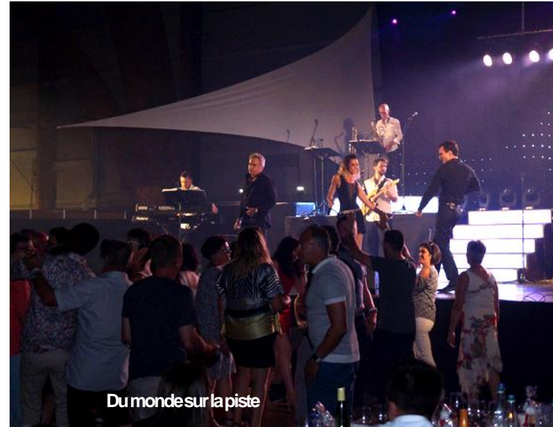
Du monde sur la piste