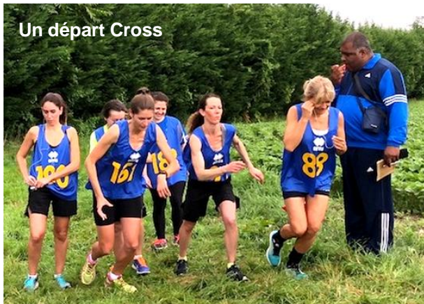
Un départ Cross