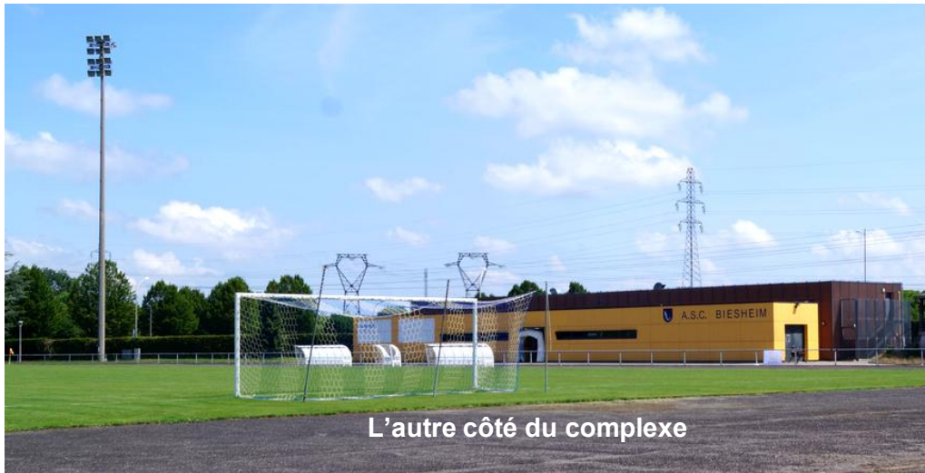
L'autre côté du complexe