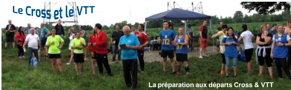
La préparation aux départs Cross & VTT