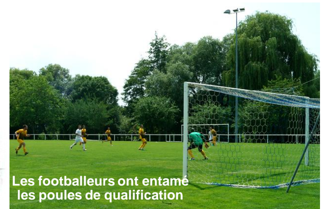
Les footballeurs ont entamé les poules de qualification