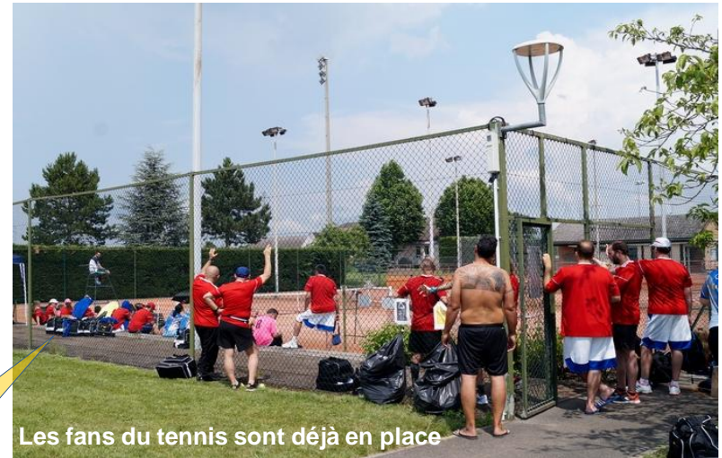
Les fans du tennis sont déjà en place