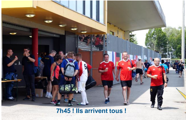
7h45 ! Ils arrivent tous !